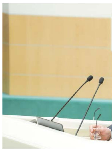
По материалам пресс-службы губернатора СК.

Благодарю команду Ставрополя за тщательную проработку представленных на рассмотрение Совета Федерации предложений. Большинство из них актуальны для многих регионов России. Особое внимание важно уделить предложениям по модернизации коммунальной инфраструктуры, ликвидации кадрового дефици-