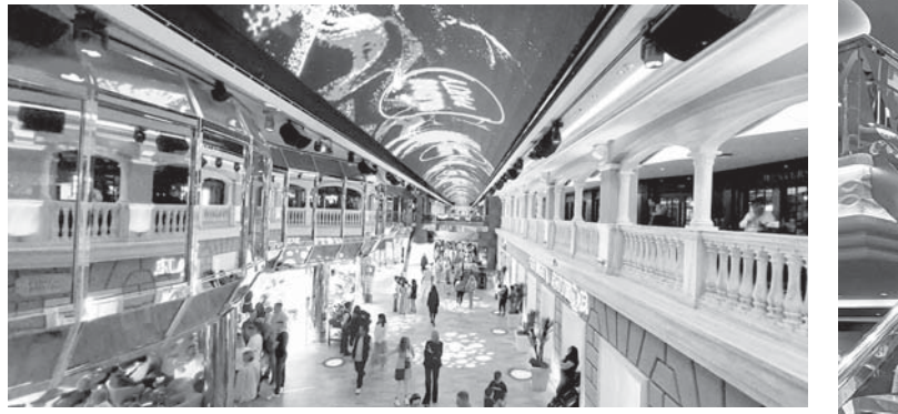
Главная торговая улица теряет вдали.

Джакузи на 18-й палубе. Аниматоры старались на славу, увлекая сотни человек в коллективные танцы и соревнования на воде. На палубе царил веселая атмосфера и легкими закусками, а в баре предлагали пиво и сухое вино. Соревнования между поварами, делающими из обычных овощей фантастические фигуры сказочных животных и различных зверюшек, привлекло толпы болельщиков. Следующие соревнования были еще более зрелищными: из глыб льда высекали фантастические птицы и рыбы, драконы и чудовища, ожерелья и короны! Едва получив оценку, эти чудопроизведения начинали быстро таять, очень расстраивая всех собравшихся, ведь это были действительно высокохудожественные произведения!