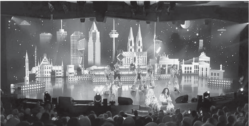
Сцена в театре.

День в море прошел в обстановке праздного безделья. Не нужно было рано вставать, торопиться на экскурсии, пересыщаться информацией от гидов, которая уже плохо усваивалась, и вертеть головой как пропеллером направо и налево, обзирая массу экзотических арабских необычностей. После не легкого, но вкусного завтрака, мы расслапились на лежаках со столиком между ними в тени солария на открытой 19-й палубе. Рядом плескался глав-