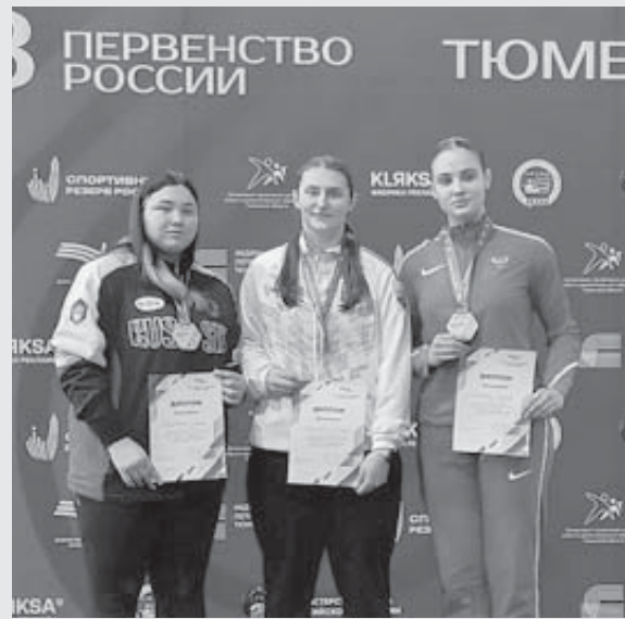
Первенство России в Тюмени.

Более 600 спортсменов из 60 регионов страны собрал в Тюмени первенство России по легкой атлетике в помещении среди юношей и девушек до 18 лет. Три награды, из них две - высшей пробы, заслужила по итогам этих соревнований ставропольская сборная.