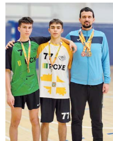
Подготовил МАКСИМ ВИТОВОВ.

Пальма первенства досталась «Слонам», серебро завоевала «Молния», тройку лучших замкнули «Орлы». По итогам турнира будет сформирована сборная, которой предстоит защищать честь родного региона в рамках первенства России.