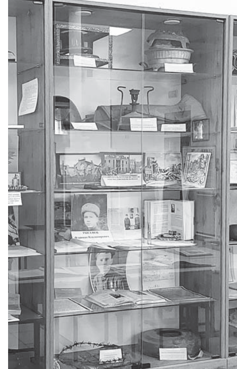
Стенд в зале боевой славы в СШ № 64.