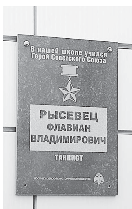
Мемориальная доска на здании СШ № 64.

Кружок картинга, 1970-е годы.