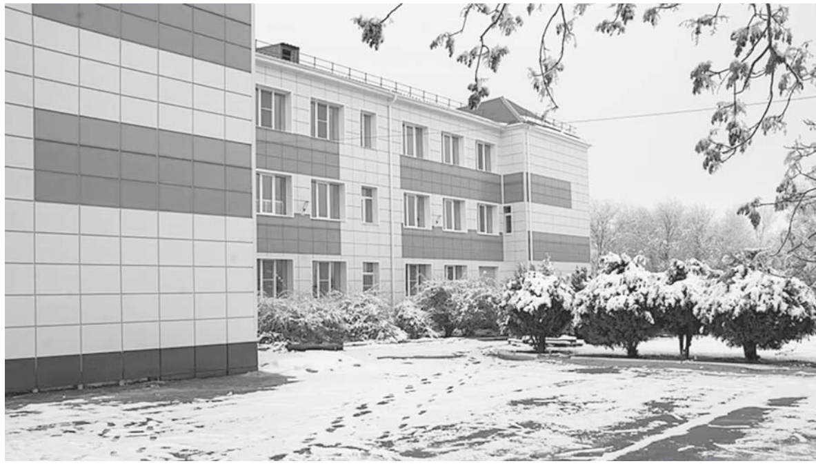
В школе № 8 села Тищенского Изобильненского округа начался второй этап капитального ремонта, стартовавшего в прошлом году. Работы идут в рамках краевого проекта модернизации школьных систем образования.

Губернатор Владимир Владимиров провел совещание по реализации на Ставрополье президентской программы капитального ремонта общеобразовательных организаций и дошкольных образовательных организаций. В нем приняли участие члены краевого кабинета, руководители ведомств, главы территорий.