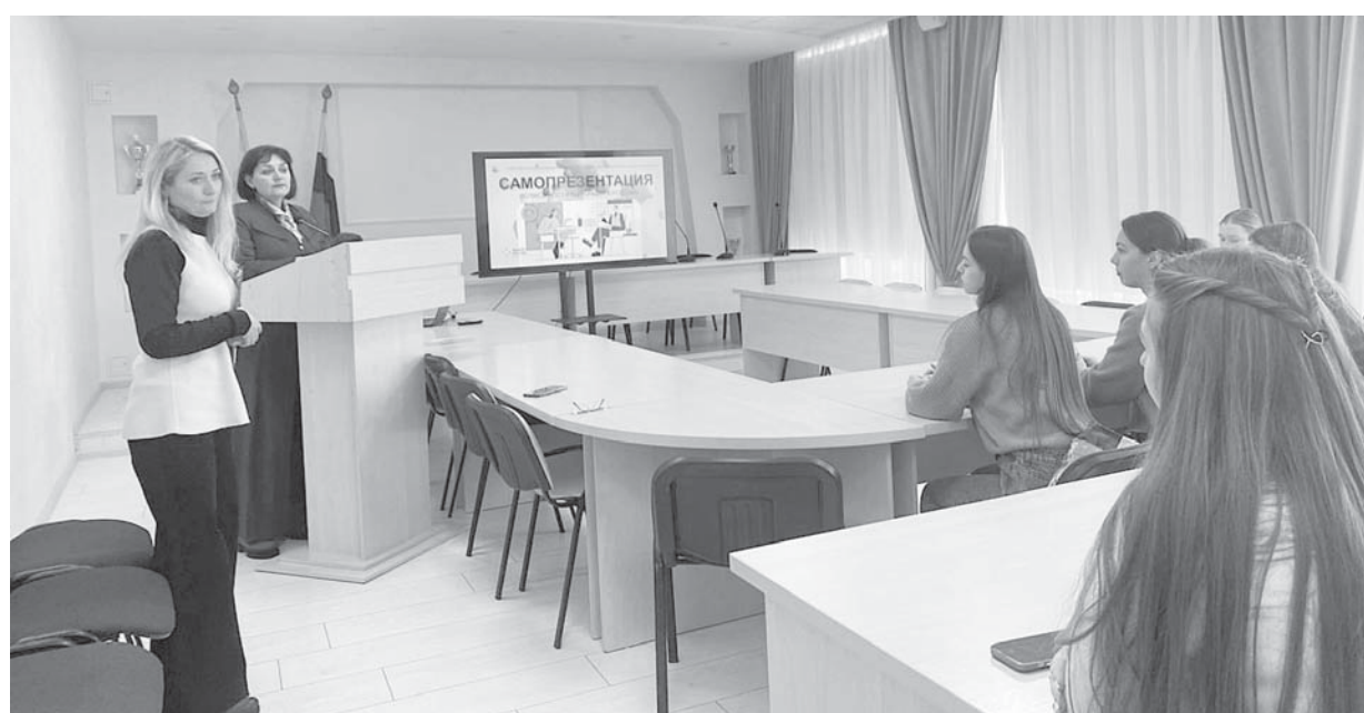
В Железноводске специалисты кадрового центра рассказали студентам о возможностях трудоустройства в Ставропольском крае.

- Минтрудом РФ был разработан единый подход, в соответствии с которым места приема посети-