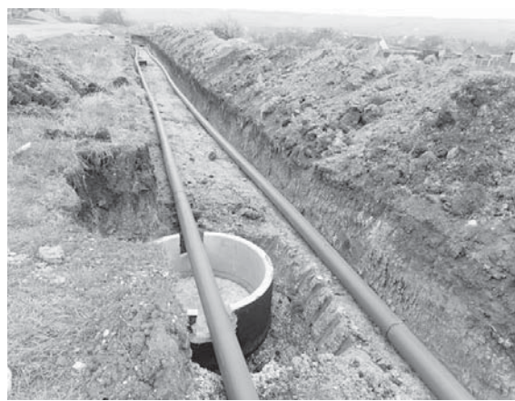
каптаж родников, реки и каналы. Более 700 - артезианские скважины.

О текущей ситуации в сфере водоснабжения и водоотведения Ставрополье доложил министр ЖКХ края Александр Рябкин. Он отметил, что более 96% - 2,8 млн человек - населения края пользуются центральным водопроводом. Менее 4% ставропольцев используют другие источники, включая индивидуальные скважины и подвоз воды. Для водоснабжения населения используется 889 источников воды. Из них 178 поверхностные: водоемы,