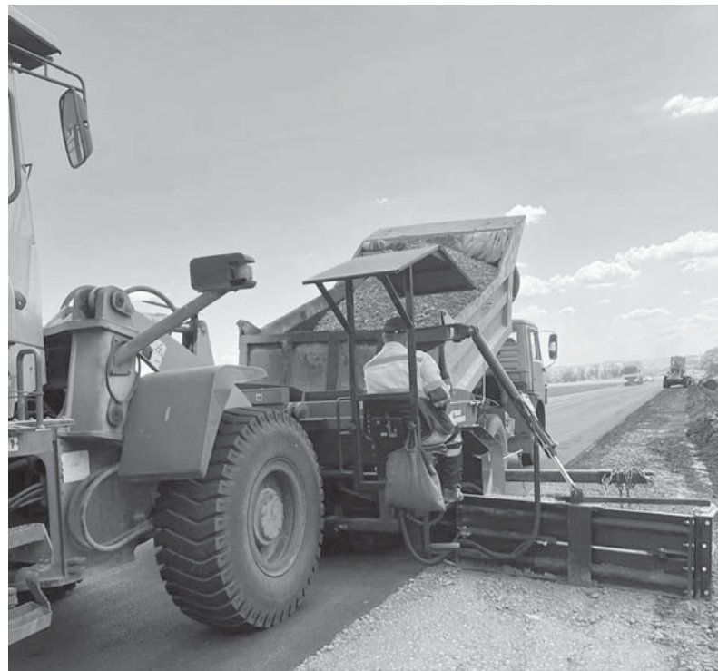
Пример комплексного подхода - ремонт участка дороги на улице Достоевского в Ставрополе

Это значит - ремонтируем не только проезжую часть, но и сопутствующие ей тротуары, переходы, уличное освещение, создаем комфортные условия не только для водителей, но и для пешеходов. Такая работа, как правило, осуществляется на территории муниципальных образований. В рамках завершающего нацпроекта «БКД» за весь период его действия таких объектов достаточно много. Хоро-