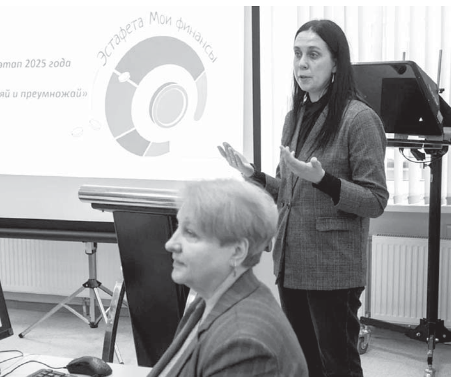
Первый этап 2025 года

Ключевые активности продолжают и в 2025 году. Работа на Ставрополье, как и в прошлом году, ведется согласно комплексному процессному мероприятию «Повышение уровня финансовой грамотности населения», включенному в государственную программу края «Управление финансами». План в числе прочего пред-