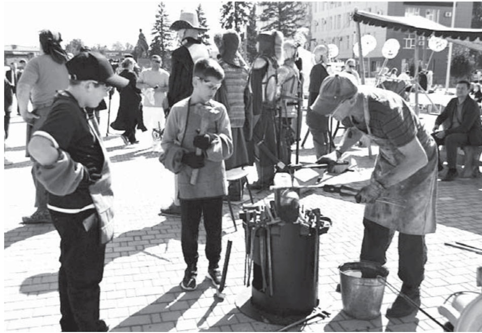
На краевом фестивале соцконтрактников «Мое дело!».

При реализации социального контракта, направленного на осуществление индивидуальной предпринимательской деятельности, малоимущий гражданин должен зарегистрироваться в ка-