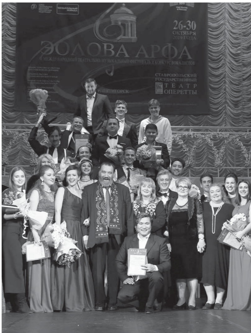
На Международном конкурсе вокалистов «Золова арфа».

Особо хочется выделить детские спектакли Пятигорского театра оперетты. Великолепо действо, веселый праздник, билеты на который раскупаются задолго до премьеры. В 2001 году театр возобновил регулярную гастрольную практику, после чего пятигорские артисты и их творчество с большой теплотой принимают в Ставрополе, Сочи, Ростове, Крыму. В сентябре этого года коллектив театра тепло принимали в городе Кирове. Разумеется, не остаются без внимания жители отдаленных районов Ставропольского края, афиши с названиями спектаклей с завидным постоянством появляются в Буденновске, Арзгире, Нефтекумске. Ко-