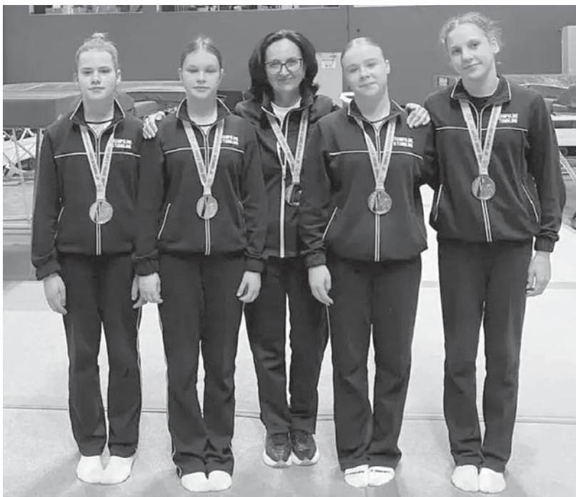
Чемпионки и победительницы чемпионатов и первенств Европы по прыжкам на батуте.