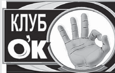
Подготовил МАКСИМ ВИКТОРОВ.

и прочих экстрасенсов им трудно задавать только один вопрос: сколько биткоинов они купили в 2010 году?