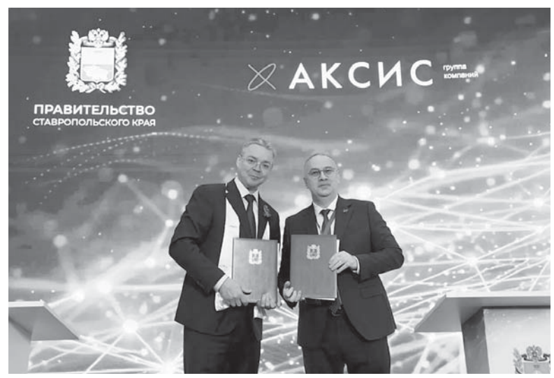
По материалам пресс-службы губернатора СК.

Развитие логистики — это ключевой фактор роста экономики региона. Мы последовательно формируем на Ставрополье современную инфраструктуру, ко-